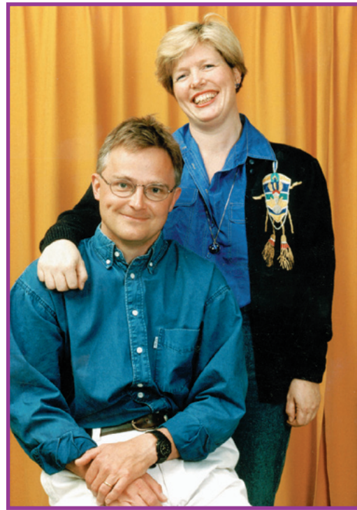
Så här ser vi ut när vi inte arbetar här.