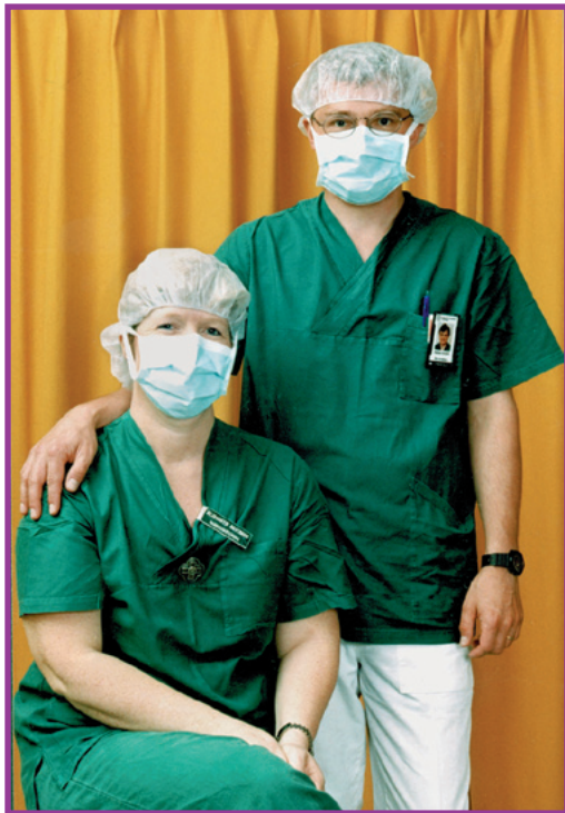
Vi som arbetar här har operationskläder på oss när vi jobbar.